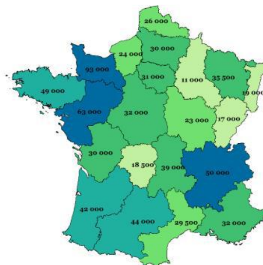
Effectifs des équidés